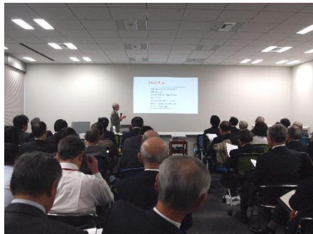
各セミナーは立ち見が出るほどの盛況ぶり