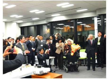
レセプションにも多くのご参加をいただきました