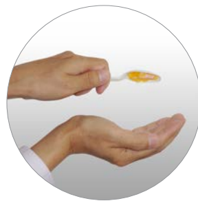
无水析出， 翻转勺子也不会脱落。