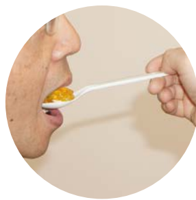
啫喱与药物成为一体， 吞服顺滑。