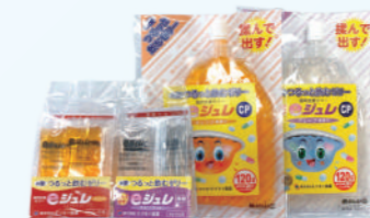
服用果冻 e Jelly