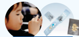
ゼリーキット剤 GT剤