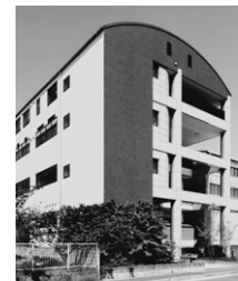
屋根がアーチ状の4階建の建物になります。